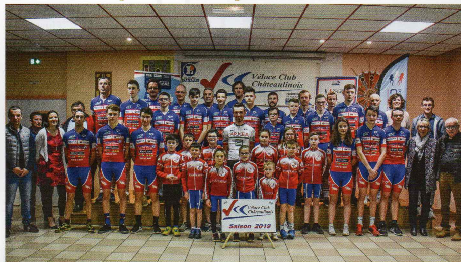
Le VC Châteaulin continue sa formation auprès des jeunes.