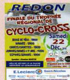
La finale se déroulera à Redon le samedi 22 décembre.