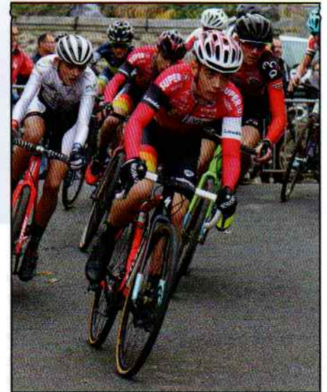
Plus de 60 cadets et cadettes étaient présents sur cette seconde manche.