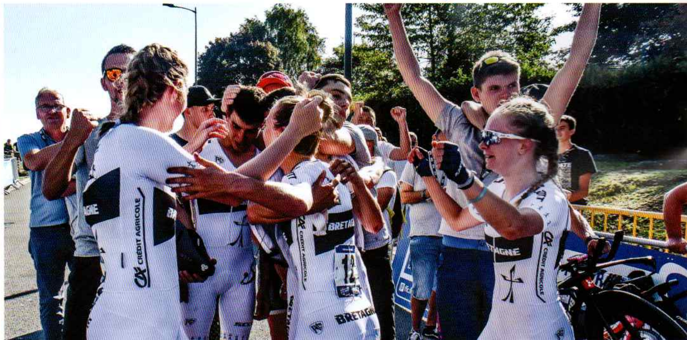
| La joie des Bretons à l'annonce de leur victoire au contre-la-montre mixte

Que d'émotions pour le clan breton tout au long de ces cinq journées d'épreuves. Fidèle à son habitude, le Championnat de France de l'Avenir a réservé son lot de joies, de satisfactions, de désillusions, de détresses ou encore de surprises. Ce cru 2019 restera sans doute gravé dans toutes les mémoires, mais aussi au plus profond de tous ceux qui ont pu vibrer au fil des coups de pédales des concurrents bretons. Au-delà des trois titres, des deux médailles d'argent et des trois de bronze glanés, la délégation bretonne a vécu une riche expérience humaine à Beauvais (Oise).