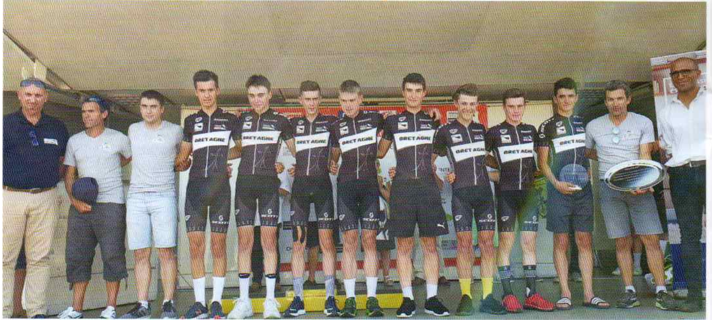
| Les Bretons ont remporté la dernière manche et la Coupe de France 2019 !