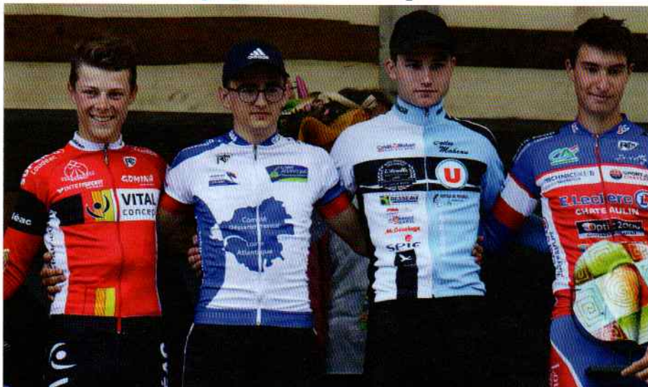
Les quatre premiers de cette édition.

le stage de préparation en Maurienne avec l'équipe de France, je devrais être au top mais je ne me sens pas à 100% » avouait le vice-champion de France qui devra se contenter de la quatrième place au sommet de Magenta.