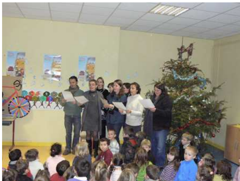
Le Véloce remercie l'ensemble des enfants de St Jo qui ont été merveilleux par leur participation, leurs qualités sportives, leur volonté et leur sagesse. Un grand merci également au corps enseignant pour leur accueil et leur disponibilité.